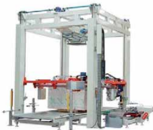
AVR 400 - FLEXA MOD. 2800

Studiata per l'avvolgimento completo di prodotti che debordano dal pallet e per imballare agevolmente le dimensioni più ampie, con la possibilità di effettuare alte produttività anche grazie al dispositivo di cambio bobina automatico.