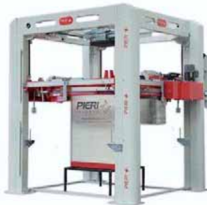
AVR 400 - FLEXA

Flexa, compatta nelle dimensioni e dalle linee dinamiche, è dotata di motorizzazione potente. Progettata con materiali innovativi che la rendono ancora più funzionale.