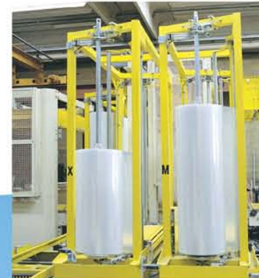
AT01 Multi ( particolare ) AT01 Multi ( particular )