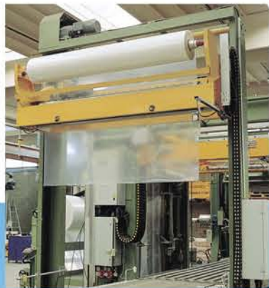
AT05 doppia bobina AT05 double reels