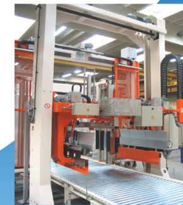
Gruppo rinalzo e puntatura Top layer-folder